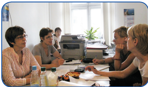
25 червня у Виконавчому офісі УБА відбулося засідання секції з адвокати, під час якого розглядалася програма відзначення Всеукраїнського дня бібліотек 2010.

Українська бібліотечна асоціація з травня 2010 р. розпочала новий проект, підтриманий Програмою сприяння Парламенту України II, і продовжує діяльність з розбудови мережі ПДГ та надання методичної допомоги бібліотекам-учасникам.