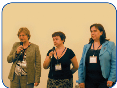
Вітання Д. Ніколсон, Генерального секретаря ІФЛА (ліворуч)

37 по 11 червня в АР Крим пройшла Міжнародна Конференція «Крим 2010», співорганізатором якої впродовж багатьох років є Українська бібліотечна асоціація. Тема 2010 р. — «Роль бібліотек у підвищенні рівня інформаційної культури та збереженні культурної спадщини в сучасних умовах розвитку суспільства». Програмою Конференції було передбачено проведення спеціального ювілейного заходу «Українська бібліотечна асоціація: 15 років лі-