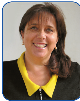
Ірина Шевченко, к.п.н., доцент, Заслужений працівник культури України, Президент Української бібліотечної асоціації

За 15 років Асоціацією було започатковано багато ініціатив, серед них – захист інтересів бібліотек, бібліотекарів і читачів, безліч звернень до різних гілок влади, участь у законодавчій та нормотворчій діяльності, професійні видання, конференції, семінари і круглі столи, міжнародні професійні програми і партнерства, традиції нагородження почесними відзнаками, інноваційні проекти і ще багато добрих справ. Сьогодні Українська бібліотечна асоціація прагне до розвитку і розбудови. Активно триває процес створення та реєстрації регіональних відділень УБА, утворюються нові секції, починають працювати адвокаційні програми, набули нової якості тренінги для бібліотекарів, оновлюється веб-сайт УБА, вже втретє проходить надзвичайно цікавий конкурс «Бібліотека року», ефективно працює виконавчий офіс